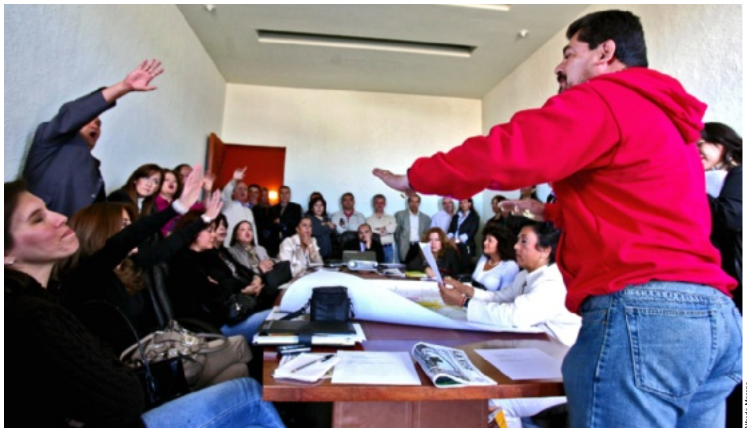
PIDO LA PALABRA. En la reunión entre autoridades y vecinos privó el desorden, pues salieron a relucir las diferencias entre líderes locales.